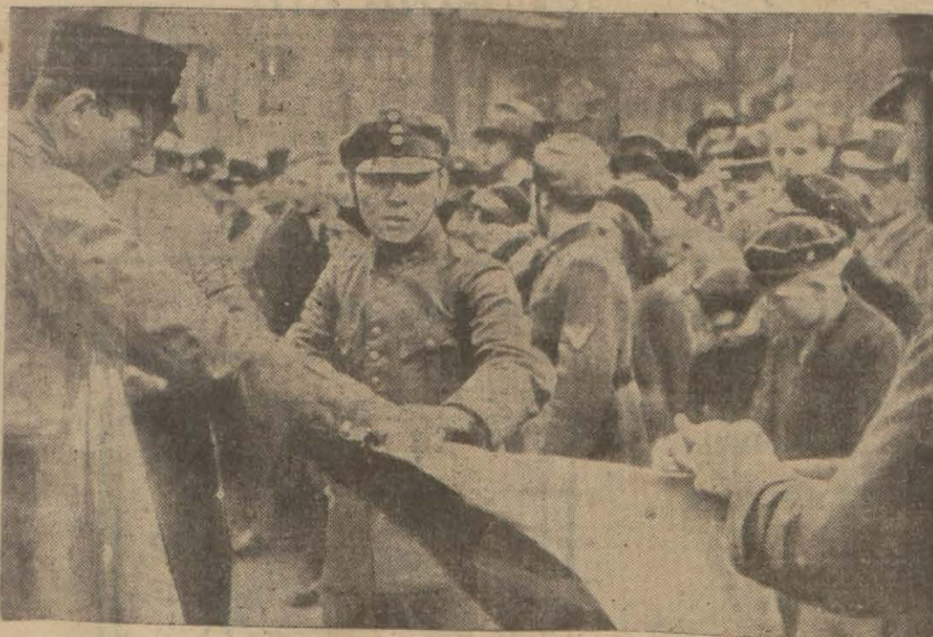
Almanya'da son nümayişlere ait bir manzara

Almanya'da Hitler partisinin iktidar mevkiine geçmesiyle başlayan Musevi aleyhtarlığı hareketleri gün geçtikçe inkişaf etmektedir. Evvelki gün ve dün gelen telgraflarda bu hareketin şiddetlendiği, Berlinde ve diğer şehirlerde birçok Yahudilerin tevkif edildiği, Musevi mağazalarından alış veriş yapılmamasını temin için tedbirler alındığı haber ve-