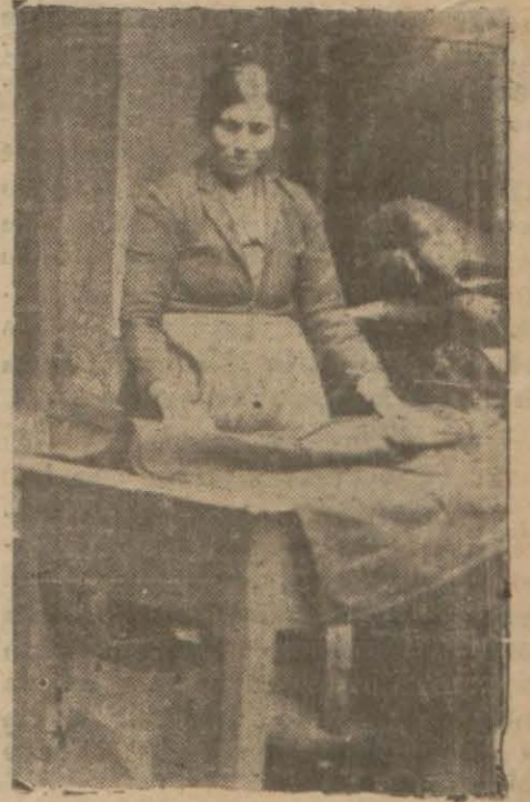
Bir İşçi Kadın

çapaklanmış, şişman bir Musevi hatunu pürülfat: