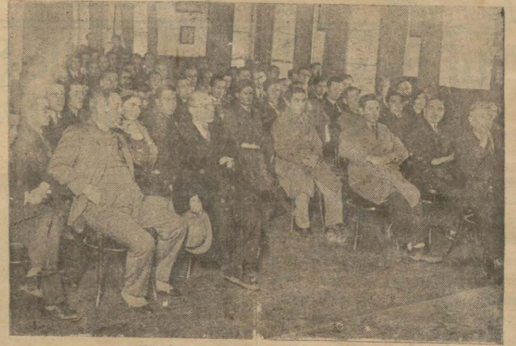
Dünkü Konferansın Dinleyicileri

Akşam üzeri Halkevi konferans salonunda Müderris Köprülüzade Fuat B. tarafından "Türk dili", hakkında bir konferans verilmektedir.